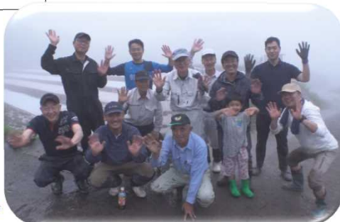
みんなで頑張りました♪

四月二十七日(土) まち協・OBS(モチ米)・他二軒の合同種まきを竹の中 江戸家で実施。雨が多く苗代田が乾かなく、ぬかるみの中の作業は大変でした。OBS社員の皆さんは翌日筋肉痛で動けなかったそうです(笑)